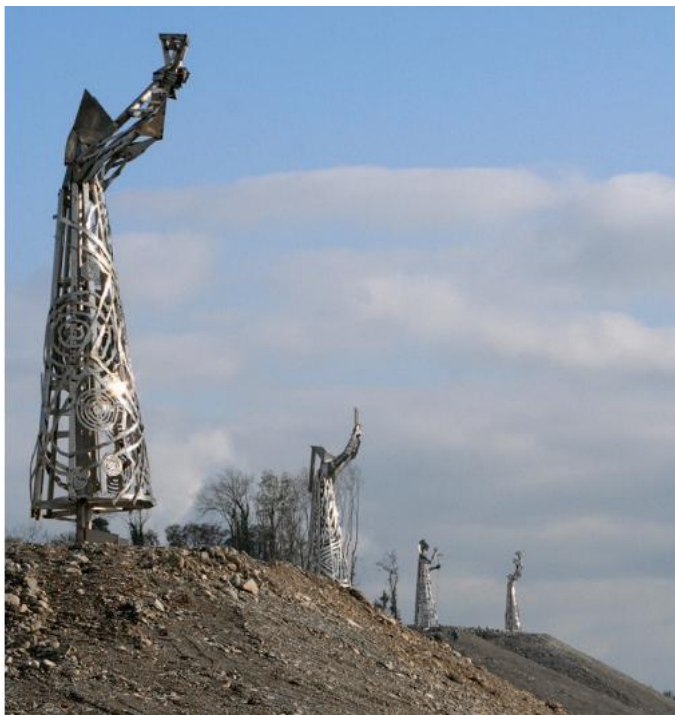
FÍOR 2.14 SAINTS AND SCHOLARS ( Na Naoimh agus na hOllaimh ), Maurice Harron, Bóthar N52, Seachbhóthar Thulach Mhór, Co. Uíbh Fhailí

Rinneadh na dealbha i nDoire i bhfoirgneamh mór a raibh trealamh ardúcháin lastuas ann. Agus na dealbha á ndéanamh baineadh leas as na teicnící ba nua-aimseartha maidir le táthú tionsclaíoch agus gearradh le léasar. Nuair a fiafraíodh den ealaíontóir cad a spreag é agus é ag dearadh na ndealbh, dúirt Harron: 'Áit thar a bheith suntasach ba ea é an suíomh; bhí ceithre chnoc ann agus bhí an suíomh gar d'ionad arsa an léinn, Mainistir Chluain Mhic Nóis. Bhí mé ag iarraidh saothar a dhéanamh in ómós don ionad sin.' Bhí sé ag súil go dtaitneodh an saothar le daoine agus gur sainchomhartha tíre a bheadh ann chomh maith le siombail don áit, agus go gcothódh sé feasacht maidir le hoidhreacht luachmhar an cheantair.