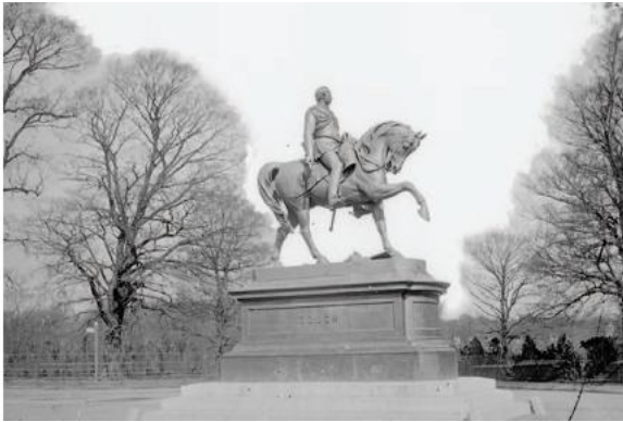
FIGÚR 2.11 LORD GOUGH MEMORIAL ( Leacht Cuimhneacháin Gough ), Páirc an Fhionnuisce, Baile Átha Cliath

Choláiste, Baile Átha Cliath agus b'iomaí drochíde a tugadh dó. Bláthanna agus sraoilleáin a bhíodh air tráth, ach uaireanta eile smearadh salachar agus tarra air. Ba é deireadh na drochíde gur pléascadh an dealbh in 1929.