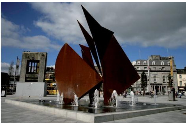
FIGÚR 2.34 GALWAY HOOKERS ( Húicéir na Gaillimhe ), Eamonn O'Doherty, An Fhaiche Mhór, Gaillimh