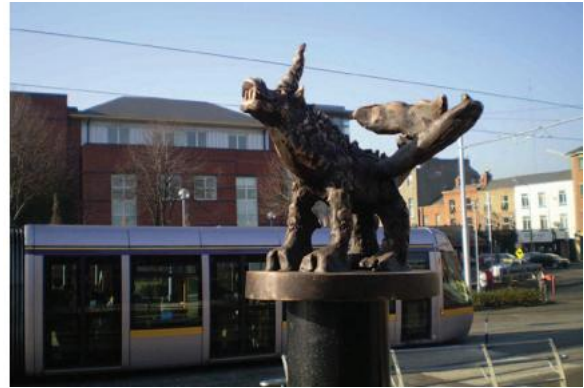
FÍOR 2.3 Gcargáil ar an Suíochán Ilfheidhmeach Beirte

Bhí sé mar chuid de thogra Walsh go mbeadh an pobal páirteach sa tionscadal ionas go mbraithfeadh siad gur leosan an saothar ealaíne. Rinne déagóirí áitiúla fíoracha as múnláí cré i gcomhar leis an ealaíontóir agus rinneadh fíoracha cré-umha díobh ina dhiaidh sin. D'oibrigh mic léinn ón Roinn Dealbhóireachta sa Choláiste Náisiúnta Ealaíne agus Deartha, atá díreach in aice lámhe, go deonach ar an tionscadal mar oidí.