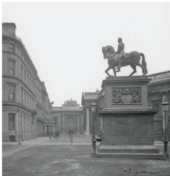
FIGÚR 2.10 WILLIAM OF ORANGE ON HORSEBACK ( Liam Oráiste ar Mhúin Capaill ), Dealbh Eachrach, Sráid an Dáma, Baile Átha Cliath

Gné thábhachtach den ealaín phoiblí i mbailte móra agus i gcathracha na hÉireann ba ea iad capaill tráth. Bhí dealbh de Rí Seoirse II agus é ar mhúin capaill i lár Fhaiche Stiabhna i mBaile Átha Cliath tráth, ach tá sé imithe le fada. Bhí dealbh de Liam Oráiste ar mhúin capaill (fíor 2.10) i bhFaiche an