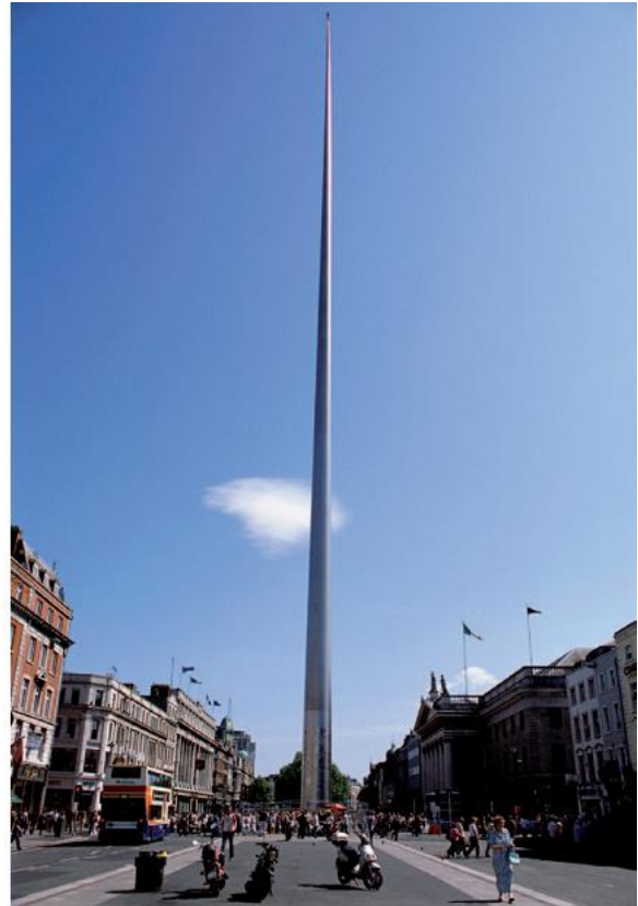
FÍOR 2.29 SPIRE OF DUBLIN—A MONUMENT OF LIGHT ( Spuaic Bhaile Átha Cliath—An Túr Solais ), Ian Richie Architects, Baile Átha Cliath

Ba é an comhlacht Ian Richie Architects a dhear an spuaic. Ba í an aidhm a bhí acu ná dearadh a dhéanamh a bheadh simplí tarraingteach snasta agus a mbeadh gné den ealaín agus den teicneolaíocht araon ann. Is cón fada ard í, í 3 m ar trastomhas ag an mbun agus 15 cm ar trastomhas ag an mbarr. As ocht bhfeadán fholmha de chruach dhosmálta a