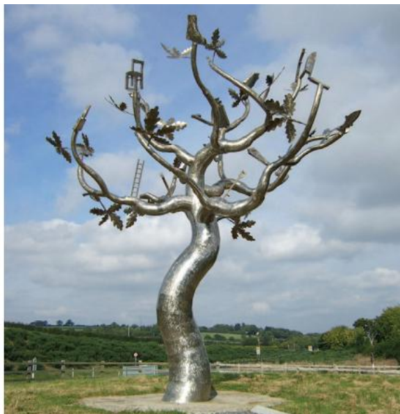
FÍOR 2.19 THE LAST OAK TREE ( An Crann Darach Deiridh ), Denis O'Connor, Bóthar N30 ó Ros Mhic Thriúin go hInis Córthaidh, Co. Loch Garman

I dtréimhse deich mbliana, mar shampla, rinne Comhairle