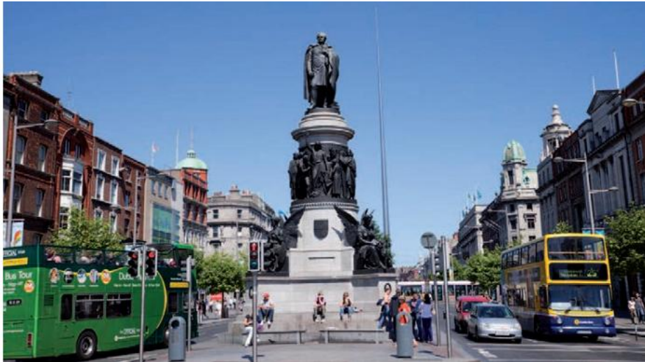
FIOR 2.30 DÓNALL Ó CONAILL, John Henry Foley, Baile Átha Cliath

Fuarthas maoiniú lena aghaidh trí shintíúis ón bpobal agus cuireadh in airde é in 1911.