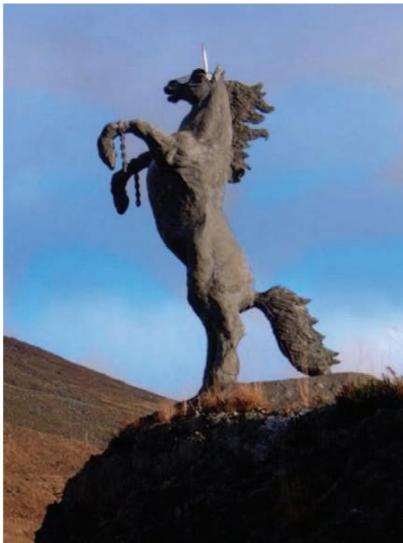
FIGÚR 2.8 AN CAPALL MÓR, íomhá gar-amhairc

Tugann muintir na háite An tAonbheannach air (fíor 2.8) agus is díol suntais é do gach duine a thaistealaíonn ar an mbóthar. Deirtear go dtiománann daoine ar an mbóthar díreach chun go bhfeicfidh a gcuid páistí An tAonbheannach .