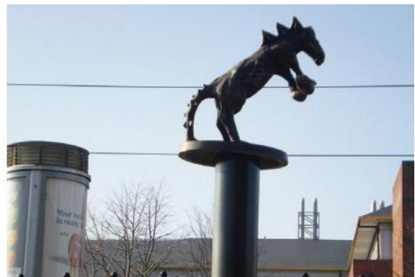
FÍOR 2.4 Gcargáil ar an Suíochán Ilfheidhmeach Beirte

Léiríonn an tionscadal seo an tábhacht atá le rannpháirteachas, le comhairliúchán agus le bheith ag comhoibriú leis an bpobal áitiúil. Tá sé tábhachtach chomh maith go mbeadh eolas ag an bpobal faoi ainm an tsaothair, faoin ealaíontóir agus faoin gcoincheap atá laistiar den saothar. Fágann sé go mbíonn tuiscint iomlán acu air agus dáimh acu leis.