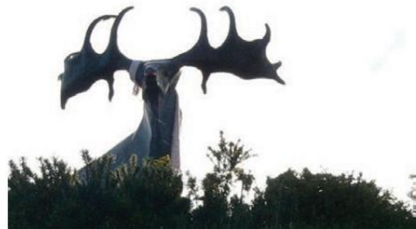
FIOR 2.27 THE GREAT IRISH DEER ( Fia Mór na mBeann ), Kevin Holland, Bóthar Mhala, Co. Chorcaí

Tagairt do stair an dúlra sa dúiche sin is ea é an saothar agus cuireadh in áit shuntasach fheiceálach é in airde ar bhruach leathaille os cionn an bhóthair.