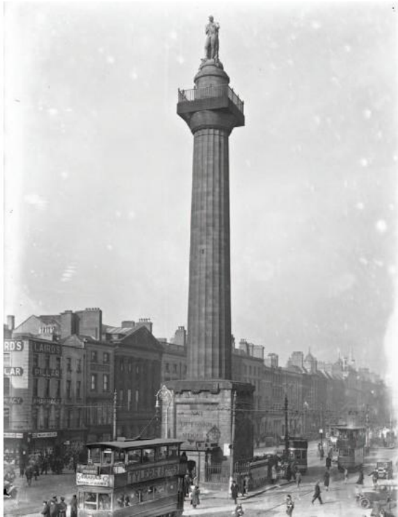
FÍOR 2.28 COLÚN NELSON, Baile Átha Cliath

i mBaile Átha Cliath. Is minic a bhíonn conspóidí ann faoi ábhar nó faoi dhearadh na ndealbh – bhí an oiread sin fuatha ar chuid acu gur scríosadh iad nó gurbh éigean iad a bhogadh.