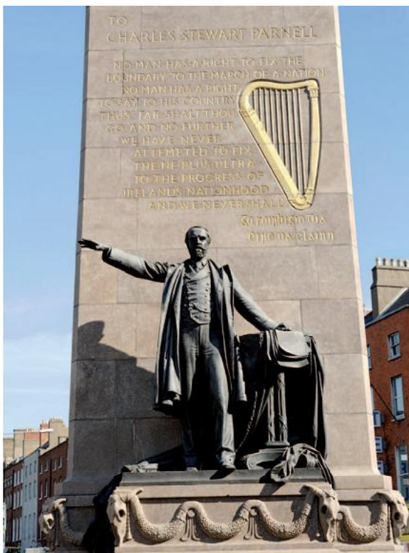
FIOR 2.31 PARNELL MONUMENT ( Leacht Pharnell ), Augustus Saint-Gaudens, Baile Átha Cliath

ina cheann feadhna ar 20,000 oibrí i rith Fhrithdhúnadh Mór Bhaile Átha Cliath, eachtra a bhfuil cur síos an-mhaith uirthi sa leabhar Strumpet City le James Plunkett. Rinneadh leiriú éifeachtach air sa dealbh; tá sé in airde ar phlionsa eibhir, agus tá a lámha sínte amach agus é i lár óráide.