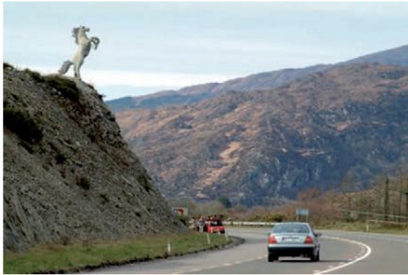
FIGÚR 2.7 AN CAPALL MÓR, Tighe O' Donoghue, Bóthar N22 go Trá Lí, Co. Chiarraí

anuas ar chreatlach chruach. Is é atá sa dealbh, capall cogaidh faoi mar a bhíodh ag na taoisigh Cheilteacha agus iad i mbun catha. Don tsaoirse a sheasann na slabhraí briste faoina chosa tosaigh.