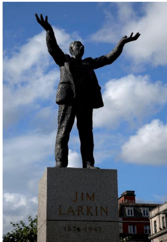
FIOR 2.32 JAMES LARKIN, Oisín Kelly, Sráid Uí Chonaill, Baile Átha Cliath