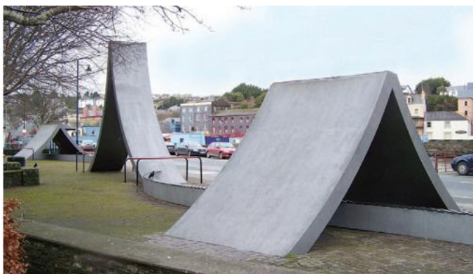
FIG 2.1 THE GREAT WALL OF KINSALE ( Balla Mór Chionn tSáile ), Co. Chorcaí.

Toisc go raibh an dealbh gar don fharrage agus toisc go raibh an samhradh tirim, níor tháinig meirg ar dhromchla na dealbhóireachta chomh tapa lena rabhthas ag súil. Bhí báisteach ag teastáil chun go dtógfadh sé an dath ceart meirge. Chuaigh an t-ealaíontóir i gcomhairle le Ceann na Rannóige Caomhnaithe i nGailearaí Tate agus mhol sé di bheith foighneach. Thug roinnt den phobal áitiúil fuath don dealbh. Is beag duine a thug cad dó ar sheas sé. Níor thug siad in aon chor cén fáth ar cuireadh píosa ollmhór d'ealaín theibí starrach déanta as miotal meirgeach i suíomh a bhí chomh hálainn sin. Scríobhadh litreacha chuig na nuachtáin, pléadh ar chlár raidió é, agus thug mórán cuairt ar leith ar Chionn tSáile chun an saothar a fheiceáil dóibh féin. Rinneadh gearáin leis an gComhairle Baile, ní hamháin go raibh sé gránna, ach bhí baol ann do dhaoine óga. Bhídis ag dul in airde ar thaobhanna cuara an dá struchtúr dhíonacha ar rothair BMX. Thaitin gníomhartha na ndéagóirí leis an ealaíontóir. Thaitin lorg na mbonn rubair ar an meirg léi go háirithe – ba chineál líníochta é, dar léi. Bhí an pobal chomh mór sin i gcoinne an tsaothair gurbh éigean ailtire a thabhairt isteach chun an dearadh a athrú. Tháinig athrú ar an dlí a bhaineann le cóipcheart ó rinneadh an dealbh in 1988 agus bheadh sé in aghaidh an dlí athruithe den chineál sin a dhéanamh ar saothar ealaine sa lá atá inniu ann.