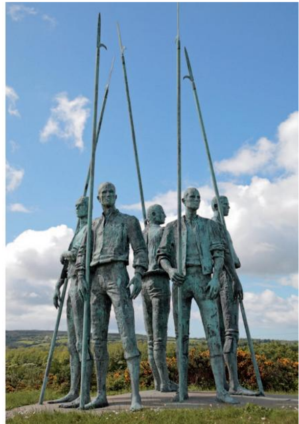
FIGÚR 2.35 FUASCALLT, Eamonn O'Doherty, Co. Loch Garman

Is éard atá ann ná cúig fhathach d'fhir déanta as cré-umha. Tá píce fhada i lámh gach duine díobh agus is é an t-ainm a thugtar orthu sa cheantar agus ar fud na tíre ná 'Fir na bPící'.