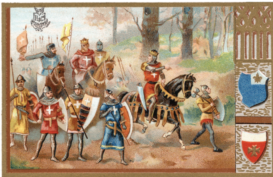
Fíor 11.3 Crosáidithe na Meánaoiseanna

D'fhógair an Eaglais ar na ridirí (fíor 11.3) éirí as a gcuid achrann agus a gcuid cogadóchta a chur chun tairbhe in arm na Críostaíochta. D'imigh siad ar na Crosáidí – cogáil na Croise nó na cogáil beannaithe – agus rún acu an Iarúsailéim agus suíomhanna naofa eile na Críostaíochta a fhuascailt ó na Muslamaigh agus na Giúdaigh. Glactar leis anois gur feachtas bhrúidiúla ba ea na Crosáidí i gcoitinne agus gur bhain leas pearsanta leo go minic.