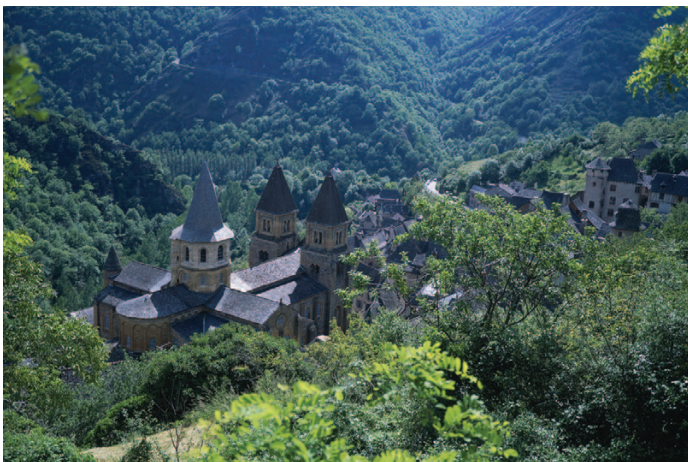
Fíor 11.1 Abbaye de Ste Foy, Conques, oirdheisceart na Fraince