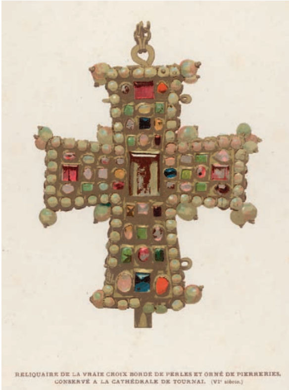
Fíor 11.4 Taise na FíorChroise

Leathnaíodh críocha na hEorpa soir dá mbarr, áfach, agus baineadh an-tairbhe as na deiseanna nua tráchtála a d'eascair as an teagmháil leis na tíortha Ioslamacha. Chuaigh sé chun sochair na hEaglaise fosta mar gur éirigh ceantair a raibh baint acu leis na Crosáidí acmhainneach is rachmasach.