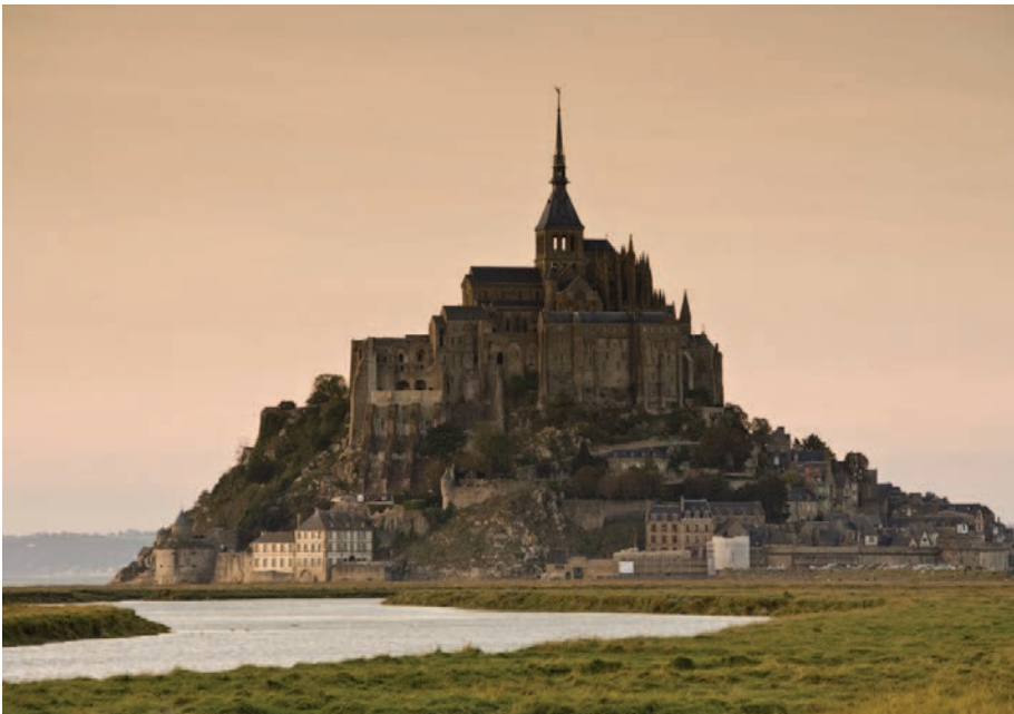
FÍOR 11.2 Le Mont Saint Michel i Normainn na Fraince