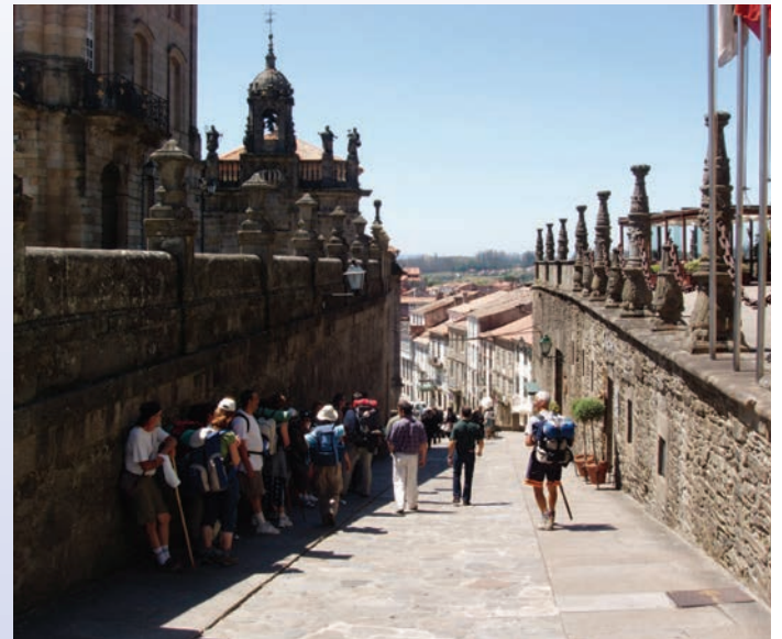
Fíor 11.5 Oilithrigh ar a mbealach go Santiago de Compostela

Mainistir mhórthabhachtach ba ea Cluny ag an am sin. Nuair a mhol ab na mainistreach sin go mbeadh Santiago de Compostela ina cheann scríbe oilithreachta, níorbh fhada go raibh sí ar an oilithrecht Chríostaí ba cháiliúla ar fad. Thug na sluaite as gach cearn den Eoraip faoin oilithrecht chéanna, muintir na hÉireann agus na Breataine san áireamh. Thaistil siad go mall de shiúl na gcós tríd an bhFrainc, isteach sa Spáinn agus an bealach ar fad trasna go himeall an chósta thiar thuaidh. Bhí líon na n-oilithreach chomh mór sin go ndeirtear go mbíodh an deichiú cuid de phobal na hEorpa ar bhóthar na hoilithreachta ag aon am ar leith. Iad ag dul go Santiago de Compostela, ag filleadh as, nó ag freastal ar na hoilithrigh agus iad ag taisteal chun guí a scrín an naoimh.